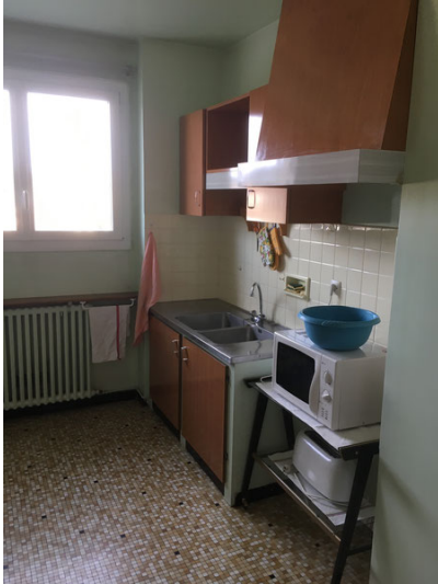
Cuisine – Photo Avant