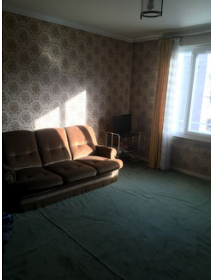
Chambre enfants – Photo Avant