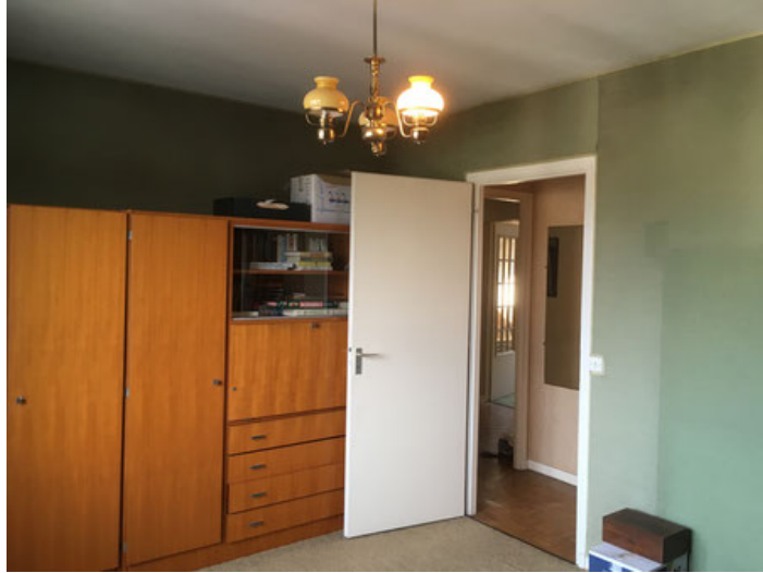
Séjour – Photo Avant