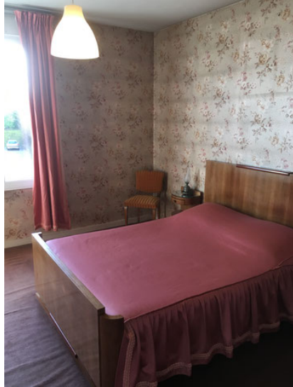
Chambre parentale – Photo Avant