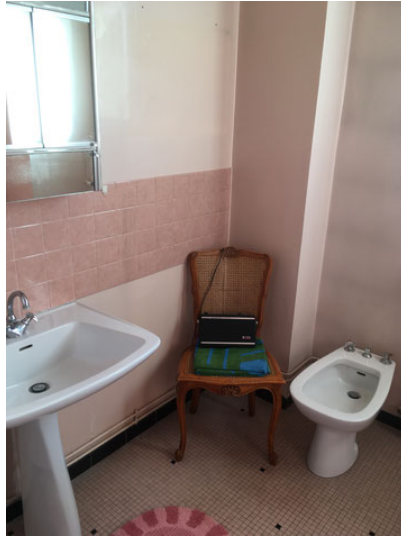
Salle de bain – Photo Avant