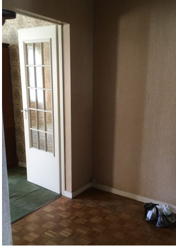
Entrée – Photo Avant